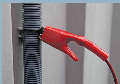
Techniques de suivi du tracé des câbles de petit diamètre