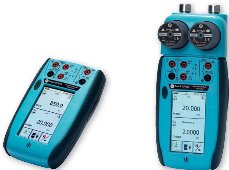
Mesure et generation de mA, mV, V, ohms, frequences, resistances Platinés et thermocouples.

La structure et le concept simples mais sophistiques combinent pour la premiere fois un calibrateur de grandeurs electriques innovant à des capacites de mesure et de generation de pression à la pointe de la technologie afin de ne plus jamais devoir sacrifier une mesure au profit d'une autre.