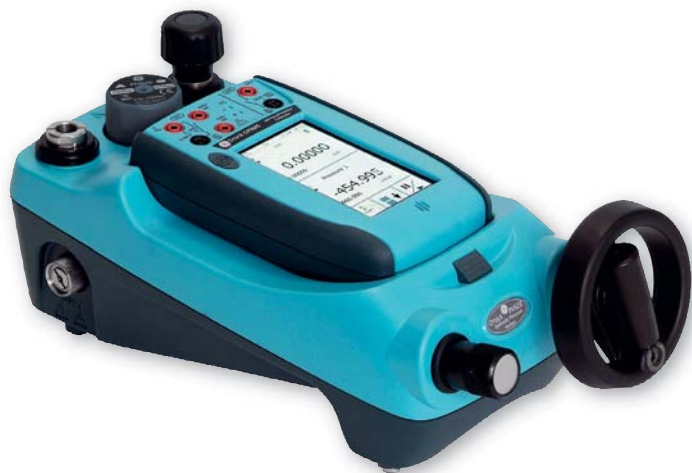
Mesure de pression interchangeable et generation entre 25 mbar et 1000 bar