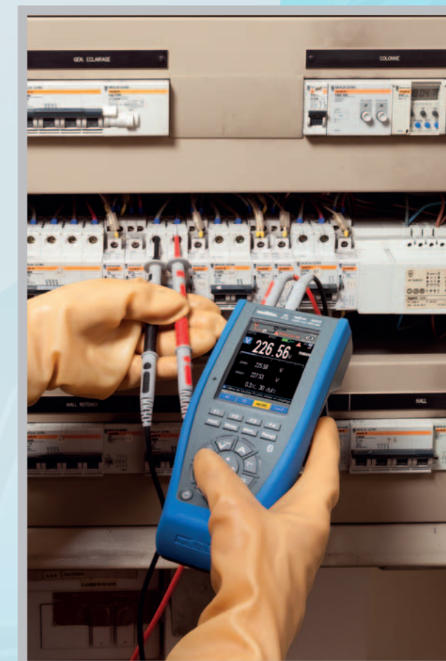
Mesures sur armoires électriques