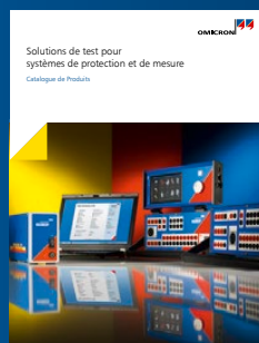
Catalogue de produits (équipements secondaires)

Les publications suivantes fournissent des renseignements détaillés sur les produits décrits dans la présente brochure et sur leurs applications :