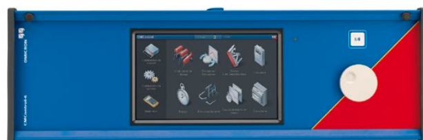
Console de pilotage manuel CMControl-6 (option)

En plus du pilotage du CMC 356 à partir de la suite logicielle performante Test Universe, il est également possible de piloter l'équipement manuellement soit avec la console de pilotage CMControl soit via le logiciel CMControl App à partir d'un PC Windows ou d'une tablette Android. Pour plus d'informations, consultez notre site Web.