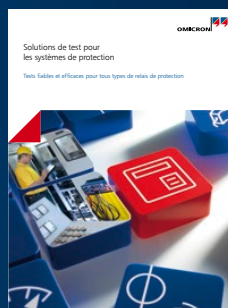
Solutions de test pour les systèmes de protection

Pour un complément d'information, une documentation supplémentaire et les coordonnées précises de nos agences dans le monde entier, veuillez visiter notre site Internet.