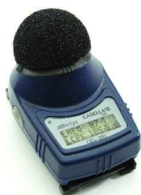
Dosimètre de bruit