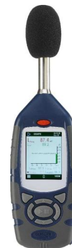
Historique du temps