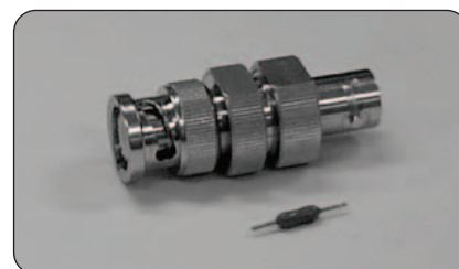
► Adaptateur de fusible BNC et fusible 0,125 A

Câble GPIB à double blindage : 012-0991-00.